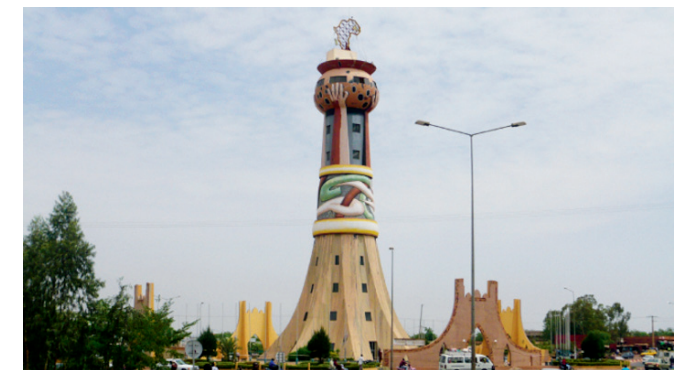
La Tour de l'Afrique (Bamako 2008)

Die Projektarbeit steht auf zwei Säulen: Zum einen werden über die ganze Laufzeit hinweg fünf Teilprojekte unterschiedlicher fachlicher Zusammensetzung und regionaler Ausrichtung das Thema mit verschiedenen empirischen Ansätzen erforschen: Historische Perspektiven richten sich auf den Wandel von Zukunftsentwürfen im 19. und 20. Jahrhundert. Visionen von Zeit und Zukunft der Natur werden anhand ökologischer und sozialer Modelle untersucht, die beispielsweise in Strategien des Naturschutzes oder im Umgang mit Klimawandel enthalten sind. Ethnologische und soziologische Ansätze widmen sich Zukunftsvisionen von Mittelschichten